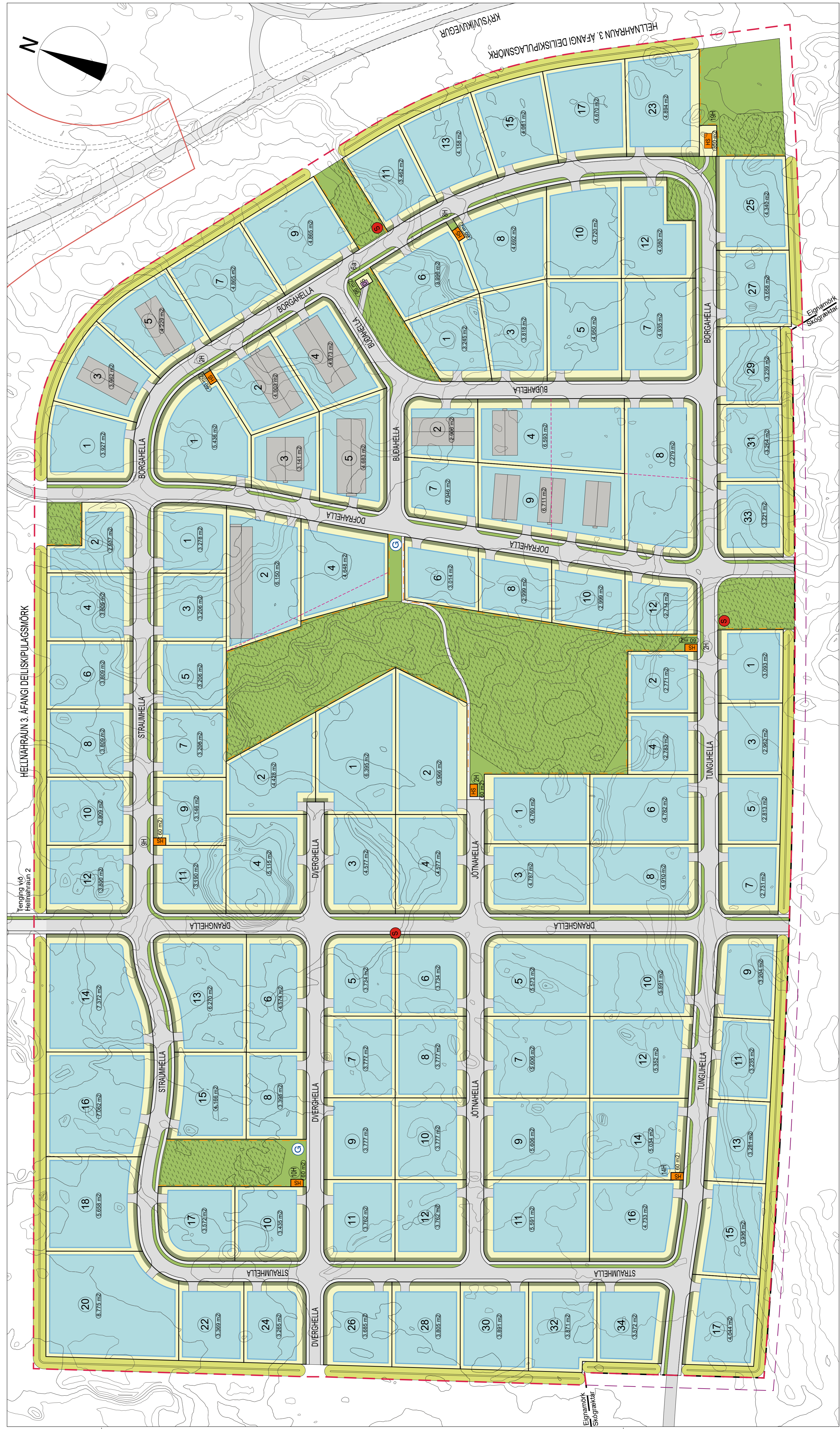
Eftir breytingu, mkv. 1:2000